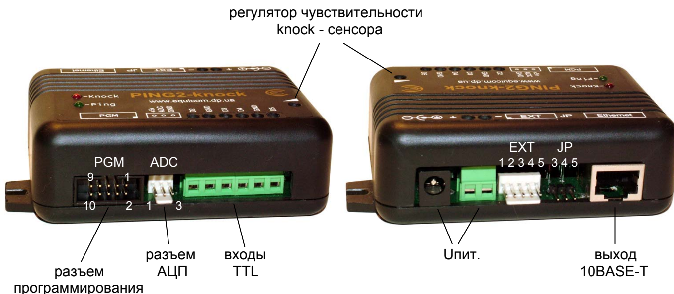
Рис. 1 PING2-knock