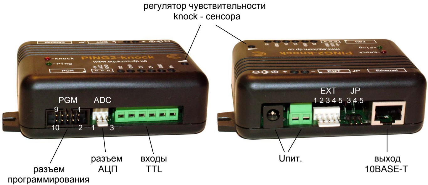
Рис. 1 PING2-knock